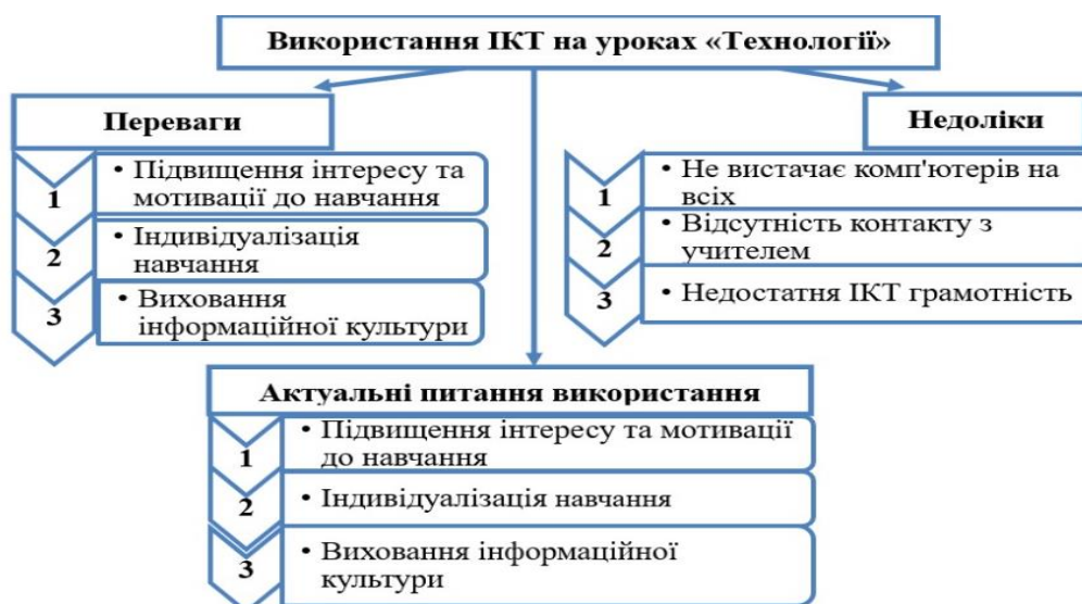
Рис. 1. Висвітлення основних переваг і недоліків, актуальних питань використання ІКТ на уроках технологій для генерування нових ідей

На основі праці [8], у даній публікації узагальнено дослідження стосовно переваг, недоліків, актуальних питань використання ІКТ на уроках технологій для генерування нових ідей, та представлено на рисунку 1: