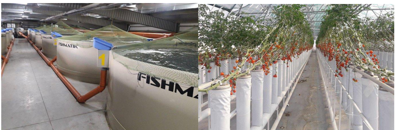
Рис. 2. Аквапонічна ферма у Василькові Київської області

Такі незвичайні ферми майбутнього вже працюють і в Україні, в яких вже зараз позбуваються від необґрунтованих витрат водних та інших ресурсів, забруднення ґрунту та застосування інсектицидів. Вони являють собою збалансовані екосистеми, здатні виробляти органіку, яка не містить токсичних речовини, які часто зустрічаються в овочевих культурах, вирощуваних традиційним методом. Одним із прикладів аквапонічна ферма у Василькові Київської області, де категорично не використовуються антибіотики, стимулятори росту і гормони. Риба росте здоровою та корисною. Мальок риби імпортується з Нідерландів. При вирощуванні риби використовуються тільки сертифіковані корми, що дає можливість забезпечити контроль за здоров'ям риби, прозорість, відповідність та відповідальність на всіх етапах виробництва (див. рис. 2) [12].