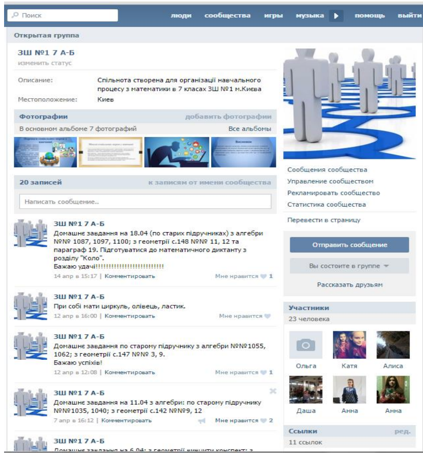
Рис 2. Інтерфейс групи для учнів 7-го класу в соціальній мережі

Відкриття в галузі ІКТ, що відбуваються в теперішній час, змушують переглядати питання організації інформаційного забезпечення навчально-виховного процесу загальноосвітнього навчального закладу. При цьому можна виділити кілька можливостей використання інформаційних технологій у процесі професійної підготовки майбутнього викладача фізики: прямий і зворотний зв'язок між користувачами ІКТ; архівне зберігання досить великих обсягів інформації з можливостями їх передачі; можливість проведення віртуального експерименту; обробка та аналіз результатів експерименту та висновків, що з них випливають; автоматичне реферування і анотування матеріалів; можливість оцінки і контролю рівня опанування відповідною навчальною інформацією і головне корегування рівня навчальних досягнень.