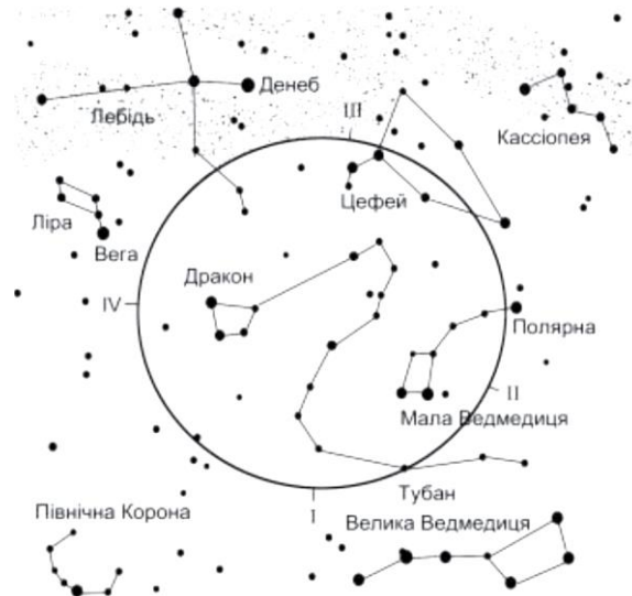
Рис. 3. Траєкторія зміщення положення північного полюсу світу внаслідок прецесії. I – за 5000 р. до н.е.; II – початок н.е.; III – 8000 р. н.е.; IV – 13000 р. н.е. [7, с.43].

Змінюється також і положення полюсів світу серед зір. Кожен з них за 25800 років описує на небі мале коло з радіусом 23^{\circ}26,5' (Рис. 3). навколо полюса екліптики. І якщо в наш час Полярною зорею є \alpha Малої Ведмедиці, то 4500 років тому Полярною зорею була \alpha Дракона (Тубан), а через 12 000 років нею буде найяскравіша зоря літнього неба \alpha Ліри (Вега).