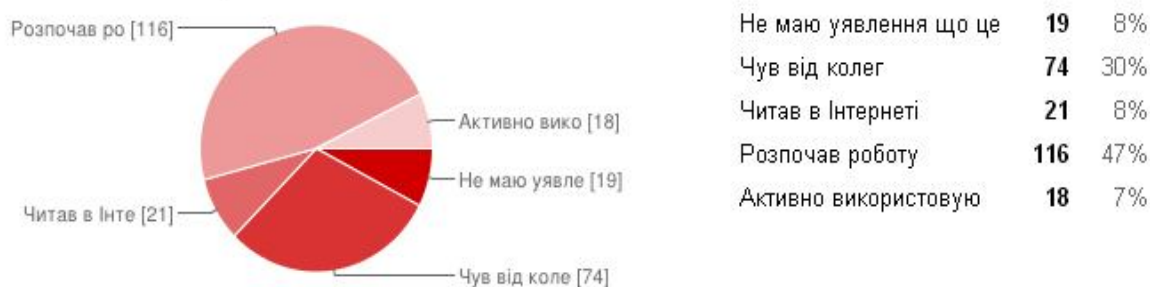
Рис. 1. Стан використання хмарних сервісів педагогами України

Стан поінформованості вчителів щодо використання хмарних сервісів у загальноосвітніх навчальних закладах: чув від колег – 30%, читав в Інтернеті – 8%, розпочав роботу – 47%, активно використовую – 7% (рис. 1). Як бачимо, 54% вчителів самостійно, без додаткових даних, тренінгів, навчальних курсів впроваджують новітні інформаційно-комунікаційні технології, що забезпечує учням загальноосвітніх навчальних закладів обізнаність з тенденціями розвитку технологій в Україні і в світі.