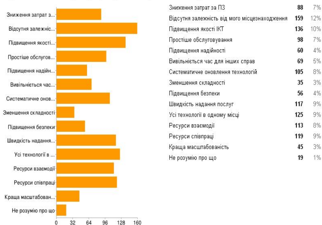
Рис. 2. Ключові вигоди від впровадження хмарних сервісів у ЗНЗ

Вчителі також відмітили ключові вигоди для навчального процесу від впровадження ХОНС, а саме мобільність учасників навчального процесу, підвищення якості інформаційно-комунікаційних технологій, усі технології в одному місці та отримання ресурсів для співпраці (рис.2).