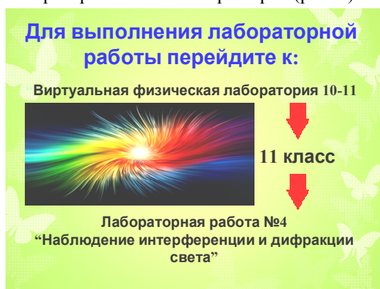
Рис. 1. Зовнішній вигляд уроку-презентації з виконання лабораторної роботи

Наприклад, лабораторна робота «Спостереження інтерференції і дифракції світла». Для виконання лабораторної роботи необхідно перейти до програми «Віртуальна фізична лабораторія» ППЗ «Квazar-мікро» (рис. 1).