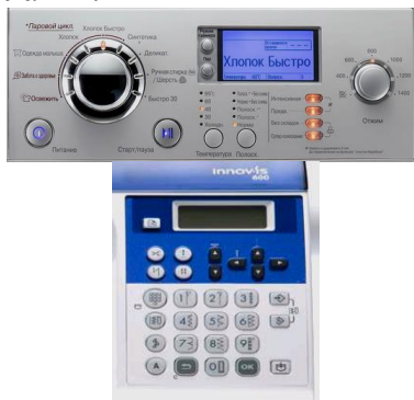
Рис. 1. Швейна машина з програмним електронним управлінням.

Перенесення знань і вмінь користування пристроєм вводу здійснюють на основі вивчення інструкцій органів керування більшістю засобів професійної діяльності учителів обслуговуючої праці. Так, на панелях органів керування переважної більшості сучасних побутових пристроїв, зокрема пральної машини-автомата і швейної машини (рис. 1.) є блок клавіш.