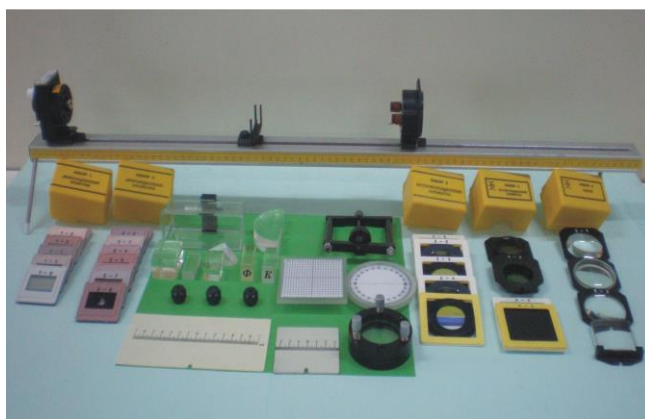
Рис. 1. Комплект оптична міні-лава та джерело випромінювання

Для підвищення якості професійної підготовки майбутніх вчителів фізики з метою реалізації вимог профільного навчання у старшій школі нами запропонована серія спецкурсів: використання ОКГ у навчанні фізики; практика з ШФЕ, розвиток технічної творчості школярів; ЕОТ у навчанні фізики; СІТН у ШКФ; вивчення рідких кристалів у ЗНЗ. Ці спецкурси оптимально поєднують реальні і віртуальні досліди у навчанні фізики і разом з тим готують їх до успішної реалізації ІКТ у навчально-виховному процесі старшої школи.