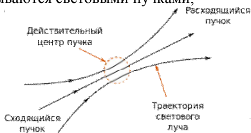
Рисунок 1. Свет, распространяющийся в прозрачной неоднородной среде, образует два пучка (сходящийся и расходящийся) с общим „размытым“ (не точечным) центром

• цилиндрические или канонические каналы, внутри которых распространяется свет, называются световыми пучками;