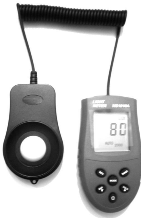
Рис. 1. Люкметр HS1010F

Виклад основного матеріалу. Проблема вирішується за наявності сучасного приладу – люкметра. Нами використаний порівняно не дорогий варіант приладу – HS 1010 A.