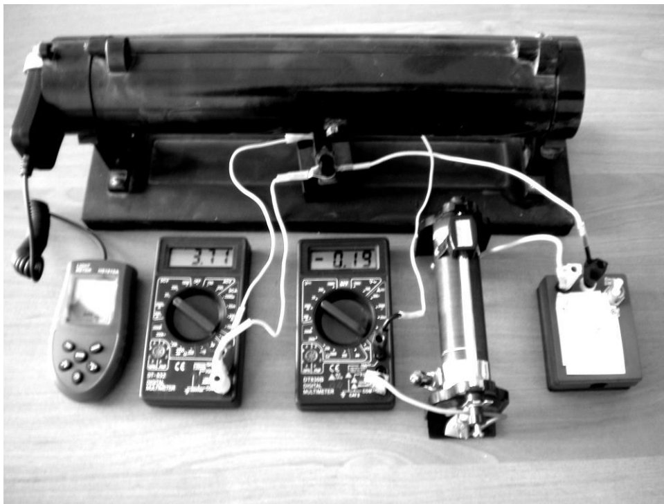
Рис. 3. Експериментальна установка до роботи «Визначення і порівняння питомих потужностей різних джерел світла».