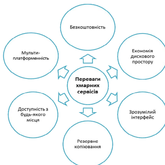
Рис. 2. Переваги використання хмарних сервісів

Для розміщення відео-матеріалів вчителем є спеціальний сервіс YouTube. Завантаживши відео на сервіс, вчителю потрібно лише надати учням адресу відео-матеріалу для перегляду.