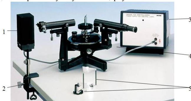
Рис. 3. Експериментальна установка: 1 – спектральна лампа, 2 – настільний затискач, 3 – джерело струму, 4 – спектрометр-ґоніометр з ноніусом, 5 – призми

4. Використайте ґратку з меншою кількістю освітлених щілин та визначте її роздільну здатність. Для цього розташуйте штангенциркуль, використаний як допоміжна ґратка, навпроти лінзи коліматора, щоб світло не доходило до щілини при зімкнутому штангенциркулі.