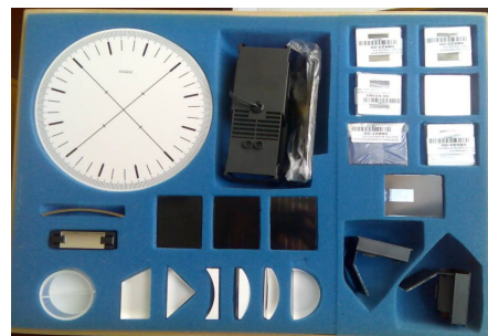
Рис. 2. Набір для виконання лабораторних робіт з геометричної та хвильової оптики

Набір з геометричної та хвильової оптики для виконання фронтальних лабораторних робіт є зручним в користуванні і компактним у зберіганні та використанні (додатки, А6, А7, А8) (рис. 2).