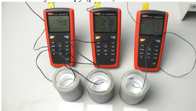
Рис. 2. Склянки, наповнені водою з різною температурою

3. Помістіть у кожную склянку термометр. Вишикуйте склянки в одну лінію і покладіть перед ними на аркушах паперу безбарвні гранули, які будуть використовуватися у якості еталону кольору (рис. 2).