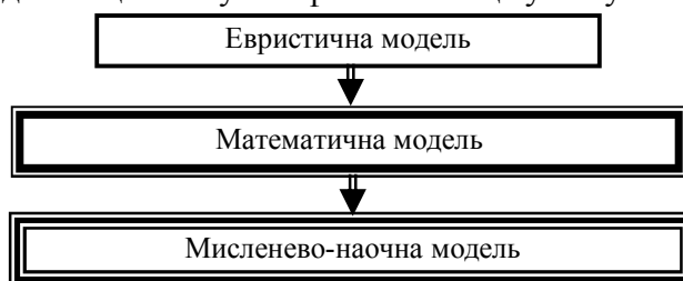
Рис. 1. Етапи формування моделей фізичного явища

Проведені нами пілотні дослідження рівня якісного засвоєння навчального матеріалу учнями VII – VIII класів показали, що формування моделей фізичних явищ і процесів, що вивчаються, значно підвищує рівень базових знань та мотивацію до вивчення фізики. В процесі вивчення фізики моделі формуються за етапами. Основні етапи формування фізичних моделей представлені на рис. 1. На першому етапі навчання фізики доцільним є формування евристичної моделі. Тобто на якісному рівні учні можуть пояснити фізичні явища що вивчаються. На цьому етапі ми відрізняємо моделі для пояснення природних явищ і процесів та моделей що описують фізичні явища у побуті.