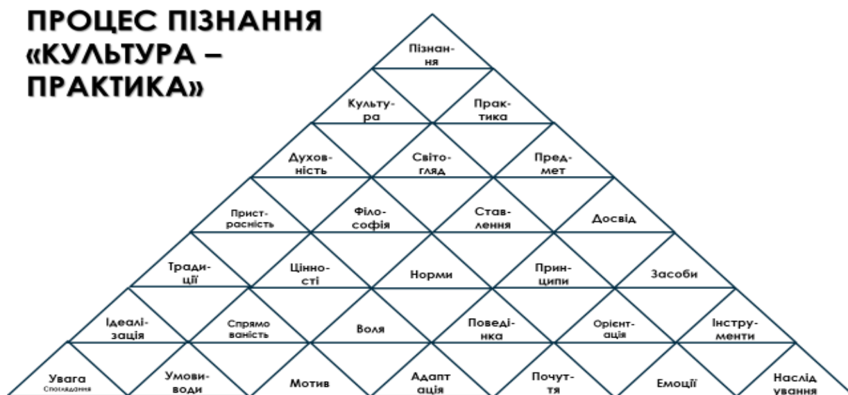
Рис. 4. Компоненти компетентності за злами «культура – практика»

Зауважимо, що запропонований базис описує компетентності, що розглядаються в контексті STEAM-освіти. Для спрощення його можна назвати НПК-базисом або НПК-технологією визначення компетентностей.