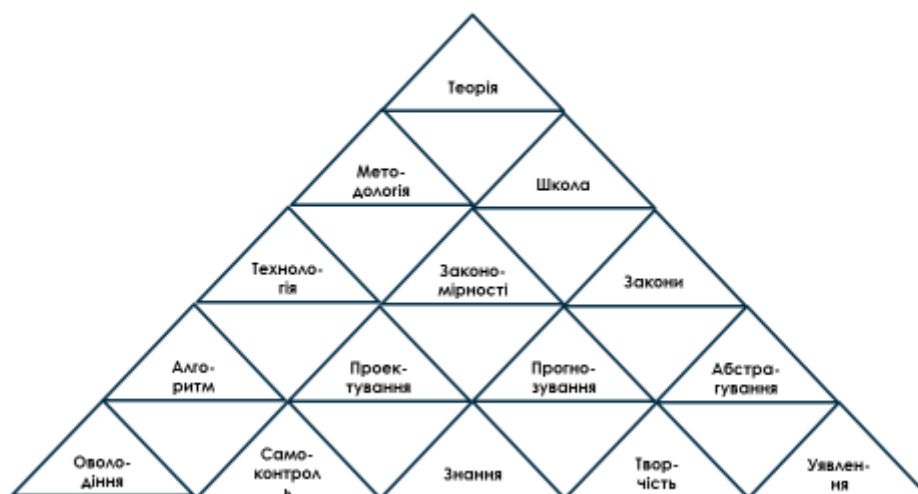
Рис. 2. Уточнення компонентів за напрямком «наука»: «теорія»