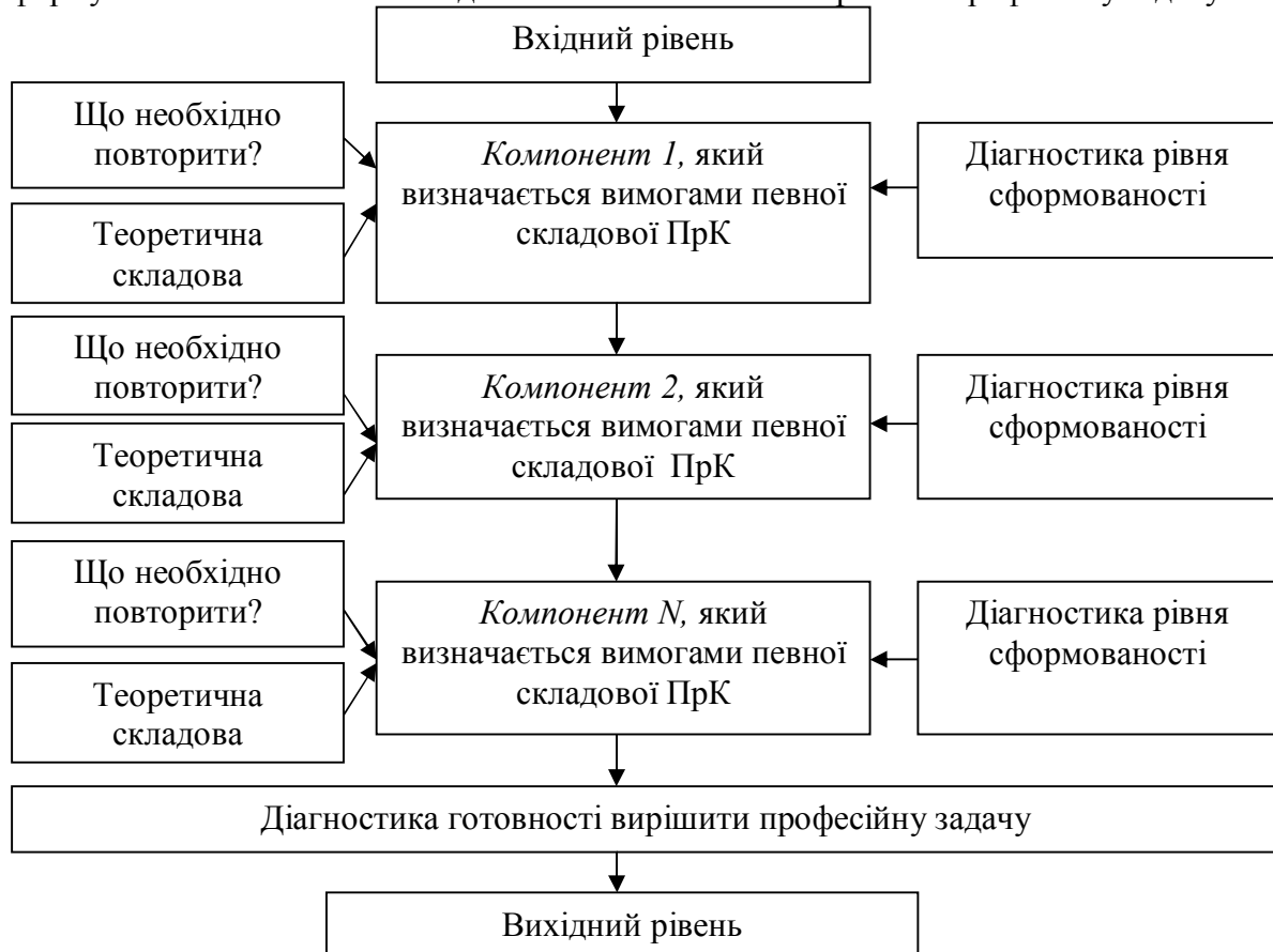
Рис. 1. Логічна структура компетентності (ПрК – предмета компетентність)

Компоненти логічної структури включають попередньо засвоєні знання («Що необхідно повторити?»); теоретичну складову, яка передбачає вивчення нового матеріалу та діагностику рівня сформованості кожного компонента. При цьому сформованість першого компонента забезпечує базу для формування наступного. Кінцевим етапом формування компетентності є діагностика готовності вирішити професійну задачу.