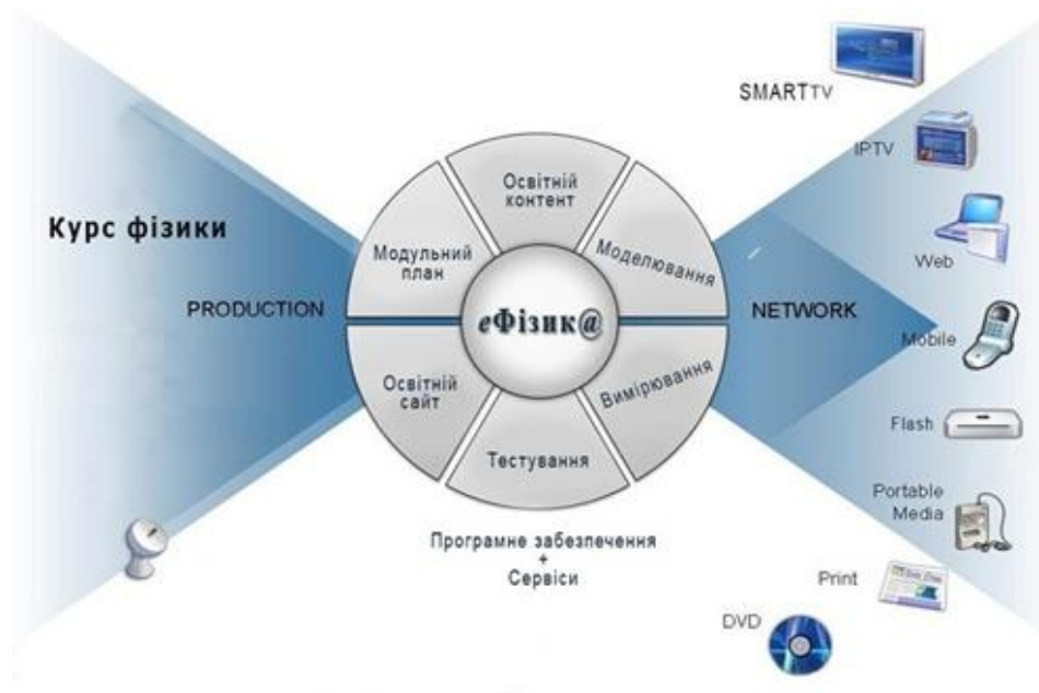
Рис. 2. Навчально-методичний комплекс «eФізика»

Виявлено і сформульовано вимоги до інформаційних і телекомунікаційних дидактичних засобів навчання фізики. Виявлено орієнтири для розробки освітнього web-сайту, застосування якого дасть можливість учням засвоїти знання з фізики.