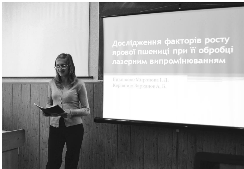
Рис. 3. Представлення результатів роботи

Висновки і перспективи подальших розвідок. Метод проектів, вибраний нами, можна вважати достатньо ефективним як у інформаційному, так і у дидактичному сенсі. В ході його використання: