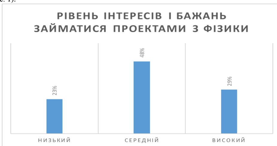
Рис. 1. Бажання студентів займатися професійно-спрямованими проектами з фізики

У результаті анкетування виявлено, що 23 % студентів не проявляють інтересу до проектної роботи, 48 % мають середній рівень мотивації, та 29 % – високий рівень бажання займатися проектними роботами з фізики (рис. 1).