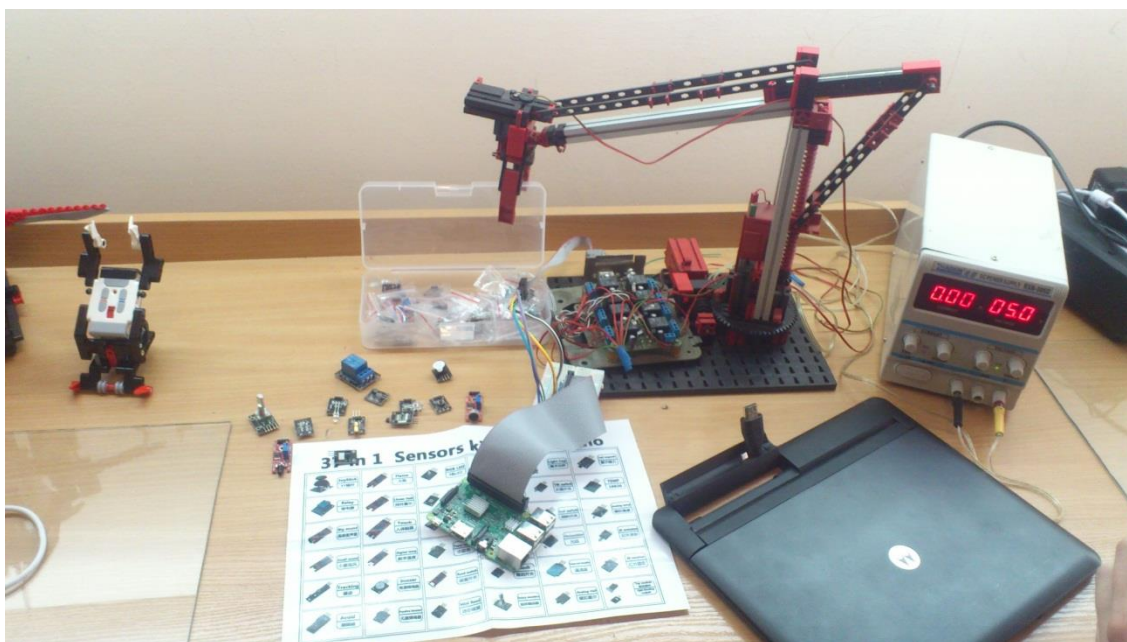
Рис. 3. Маніпулятор на основі Fischertechnik та Raspberry Pi3

Пропонується розглядати розробку подібних апаратно-програмних комплексів саме у вказаній послідовності. Arduino – одна з найлегших платформ для реалізації систем контролю, тому виконує додаткову функцію при подоланні психологічного бар'єру при знайомстві студентів з подібним обладнанням. Системи на базі STM32 через низьку вартість та високі технічні характеристики сьогодні набули значного поширення у розробників, хоч і володіють високою складністю попередньої конфігурації розроблюваного проекту та подальшого написання програмного забезпечення. При виконанні другого етапу лабораторних робіт студенти отримують безпосередні навички розробки промислових контролерів, що вимагається від подібного фахівця на виробництвах. Raspberry Pi, будучи одноплатним міні комп'ютером володіють найвищою швидкістю та найвищим потенціалом серед приведених платформ. Даний комп'ютер придатний для розробки складних систем контролю, наприклад з вбудованими модулями самодіагностики, WEB-серверу, повним функціоналом аудіо- та відеовідображення контрольованих процесів та інше. Дане застосування дозволяє реалізувати процеси розробки повнофункціональних SCADA-систем нового покоління.