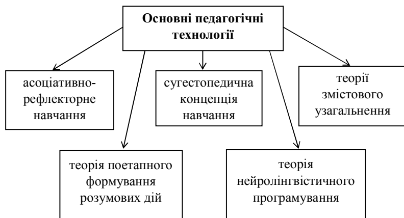
Рис. 2. Концепції засвоєння соціального досвіду в основних педагогічних технологіях

Зокрема, це стосується майбутніх фахівців комп'ютерних систем, процес навчання яких повинен базуватися на найсучасніших педагогічних технологіях. Адже, студенти даного напрямку повинні