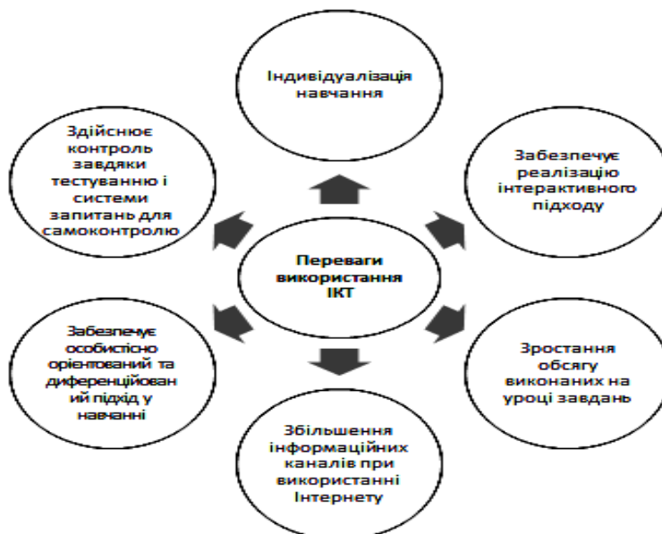
Рис. 1. Переваги використання інформаційно-комунікаційних технологій у навчальному процесі

Виклад основного матеріалу дослідження. Людство заповонило нові технології, телебачення, комп'ютери, ігрові приставки, Інтернет. Кожна сфера діяльності людини комп'ютеризована: фінансова, будівельна, сільськогосподарська та інші. Результатом цього є економія часу та грошей, комфорт та більша ефективність. Як показують дослідження [8; 9; 10], на сьогоднішній день освітня галузь також повинна у повному обсязі використовувати ІКТ. Тому що вони дають безліч переваг, див. рис. 1.