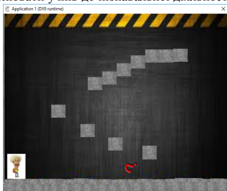
Рис. 3. Вигляд першої перешкоди

Завдання повинні відповідати програмі, а при розробці довідки потрібно пам'ятати, що матеріал повинен бути доступним та науковим. Запропонована форма організації навчальних занять повинна стимулювати учнів до пізнавальної діяльності, особливо в 7-9 класах.