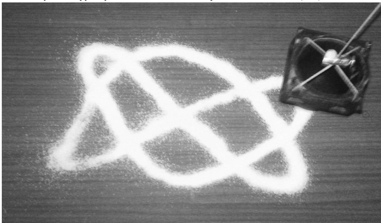
Рис.4. Фигура Лиссажу

Воронка, подвешенная на нитях, охваченных фиксатором, является примером системы с двумя степенями свободы, в которой можно одновременно возбудить взаимно-перпендикулярные колебания, соответствующие двум модам. Такой маятник может колебаться относительно оси, проходящей через плоскость подвеса (вертикальная плоскость) и относительно оси, перпендикулярной к первой и проходящей через точку фиксатора (горизонтальная плоскость). Очевидно, что частота первых колебаний меньше частоты вторых. Подобрал положение колечка таким образом, чтобы отношение частот равнялось 3:1, наполним воронку маятника песком. Зажав пальцем руки отверстие, отклоним воронку по диагонали экрана и толчком приведем маятник в колебательное движение. Фигура Лиссажу, которую описывает движущаяся воронка и повторяет высыпавшийся песок, зависит от направления этого толчка. При начальном толчке воронки в направлении, лежащем в плоскости штатива, на экране появится «приплюснутая восьмерка» (рисунок 4). Передвигая фиксатор по нитям маятника, можно получать фигуры Лиссажу, соответствующие другому соотношению частот нормальных колебаний (мод).