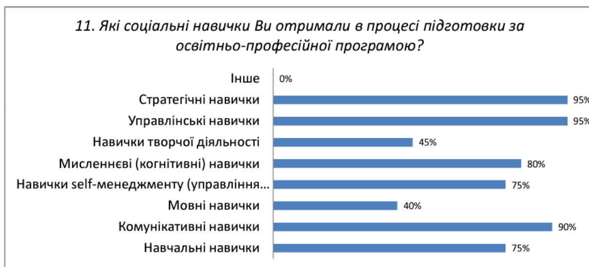
Рис.1. Візуалізація даних відповідей на запитання «Які соціальні навички Ви отримали в процесі підготовки за освітньо-професійної програмою?»

12. Загальний рівень викладання за ОПП Управління фінансово-економічною безпекою спеціальності 073 Менеджмент задовольняє всіх опитаних студентів (100%).